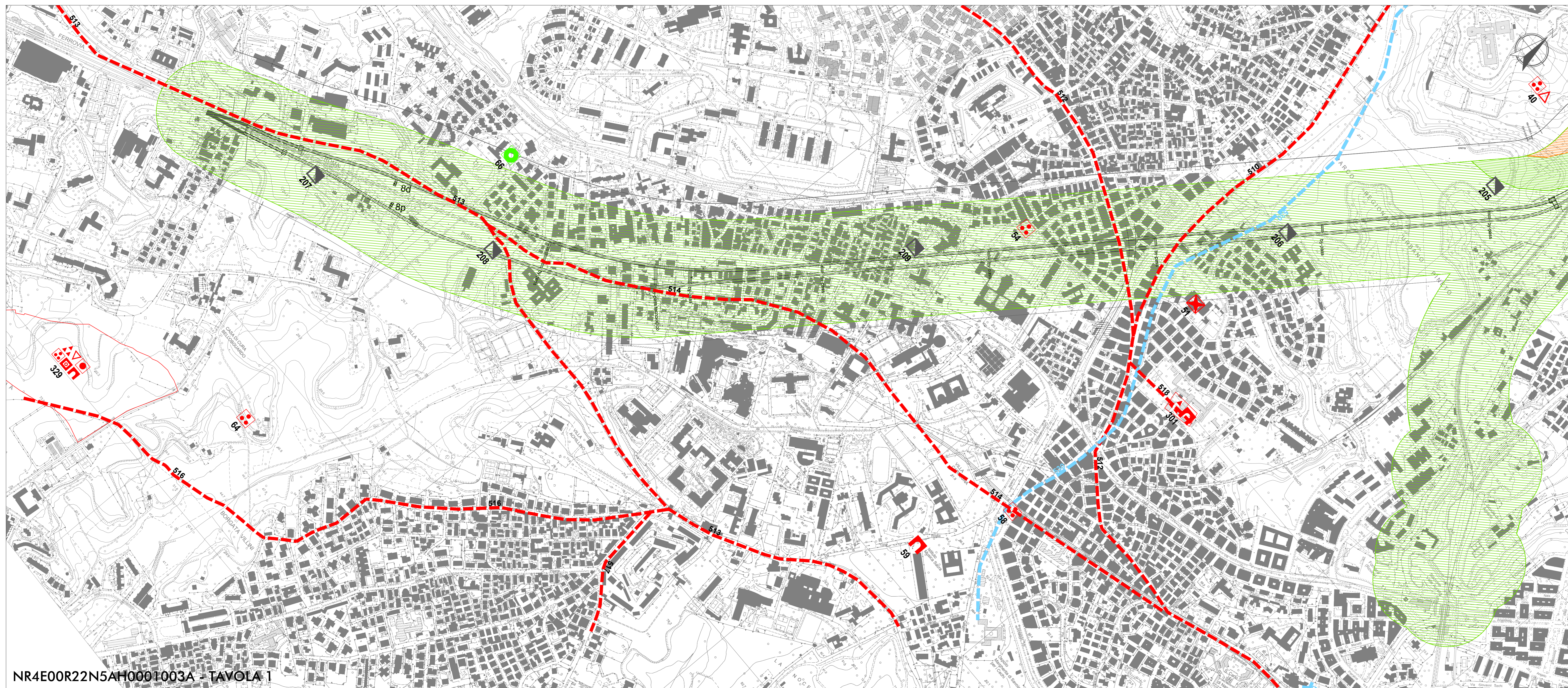
NR4E00R22N5AH0001003A - TAVOLA 1