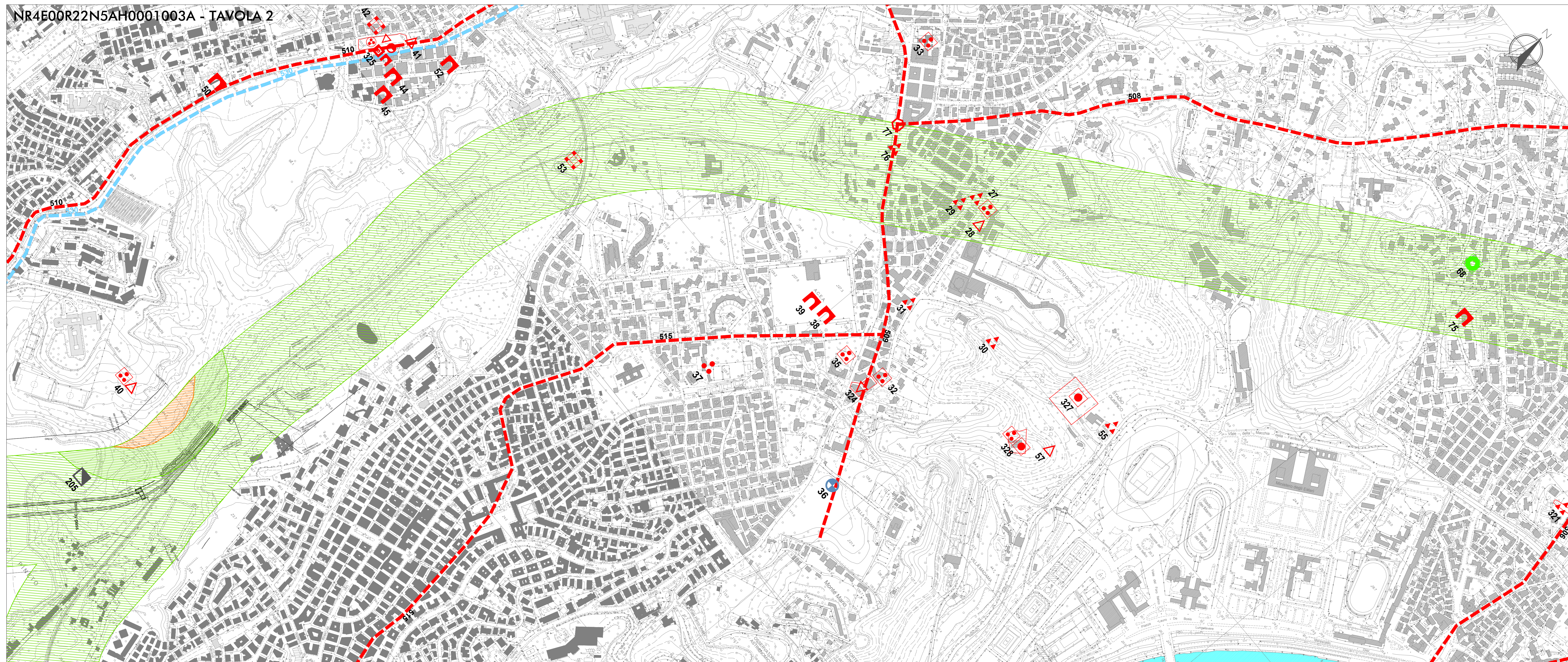
NR4E00R22N5AH0001003A - TAVOLA 2