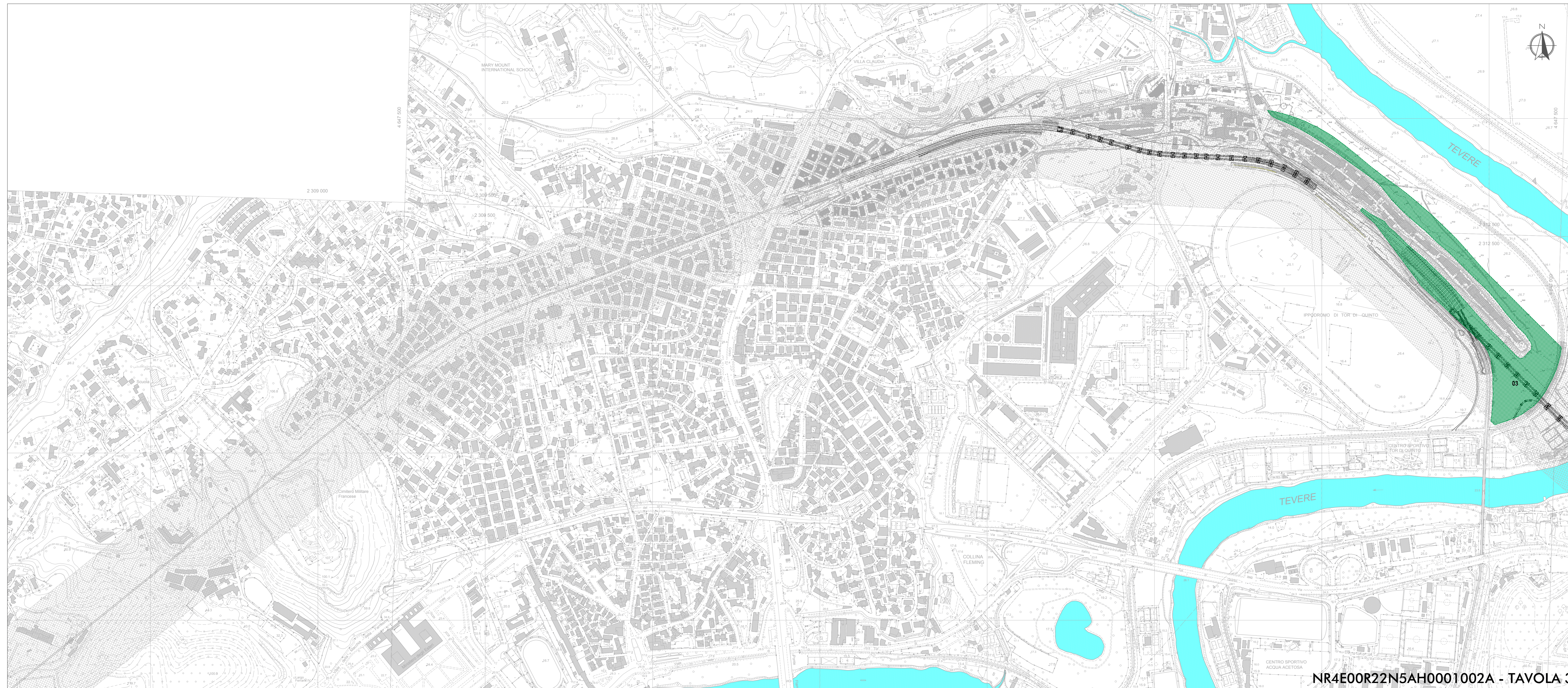
NR4E00R22N5AH0001002A - TAVOLA 3