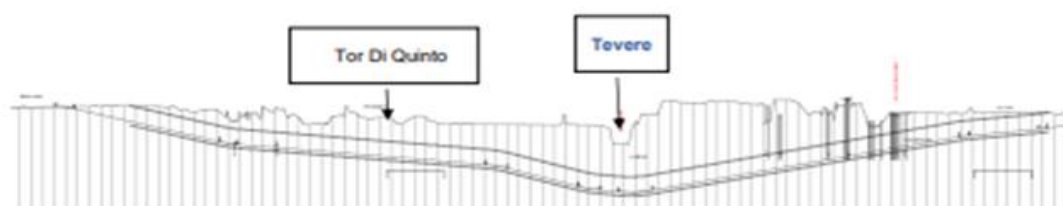
Figura 8: Planimetria e profilo soluzione totalmente in sotterraneo