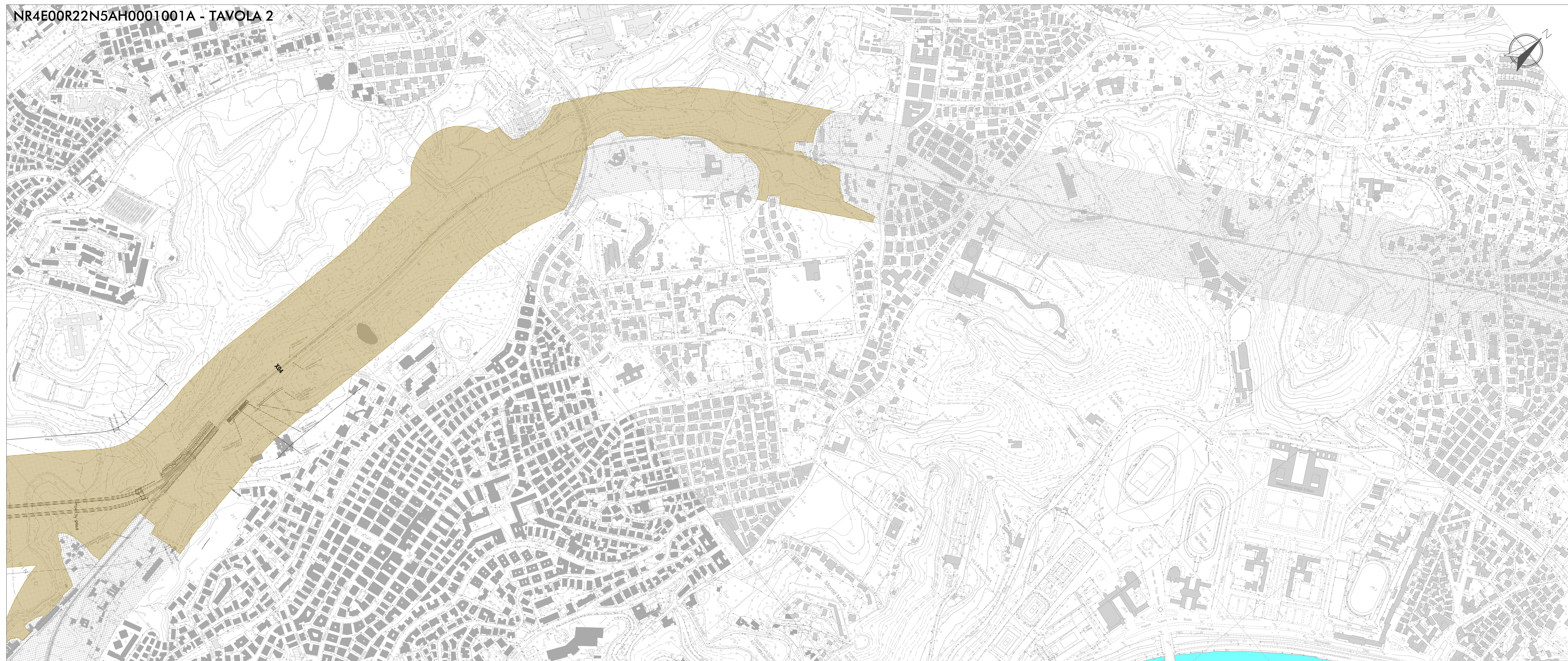
NR4E00R22N5AH0001001A - TAVOLA 2