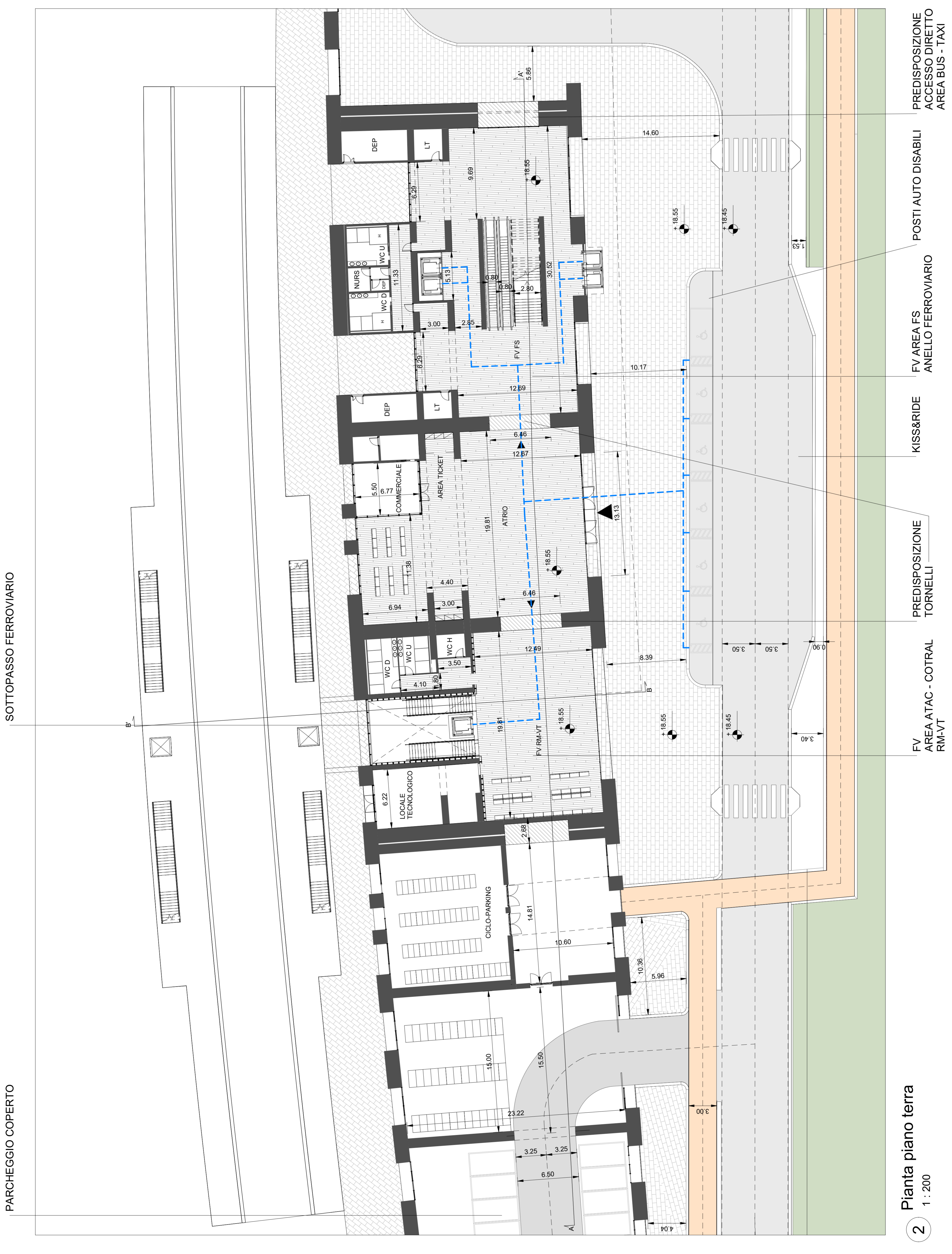
2 Pianta piano terra 1 : 200