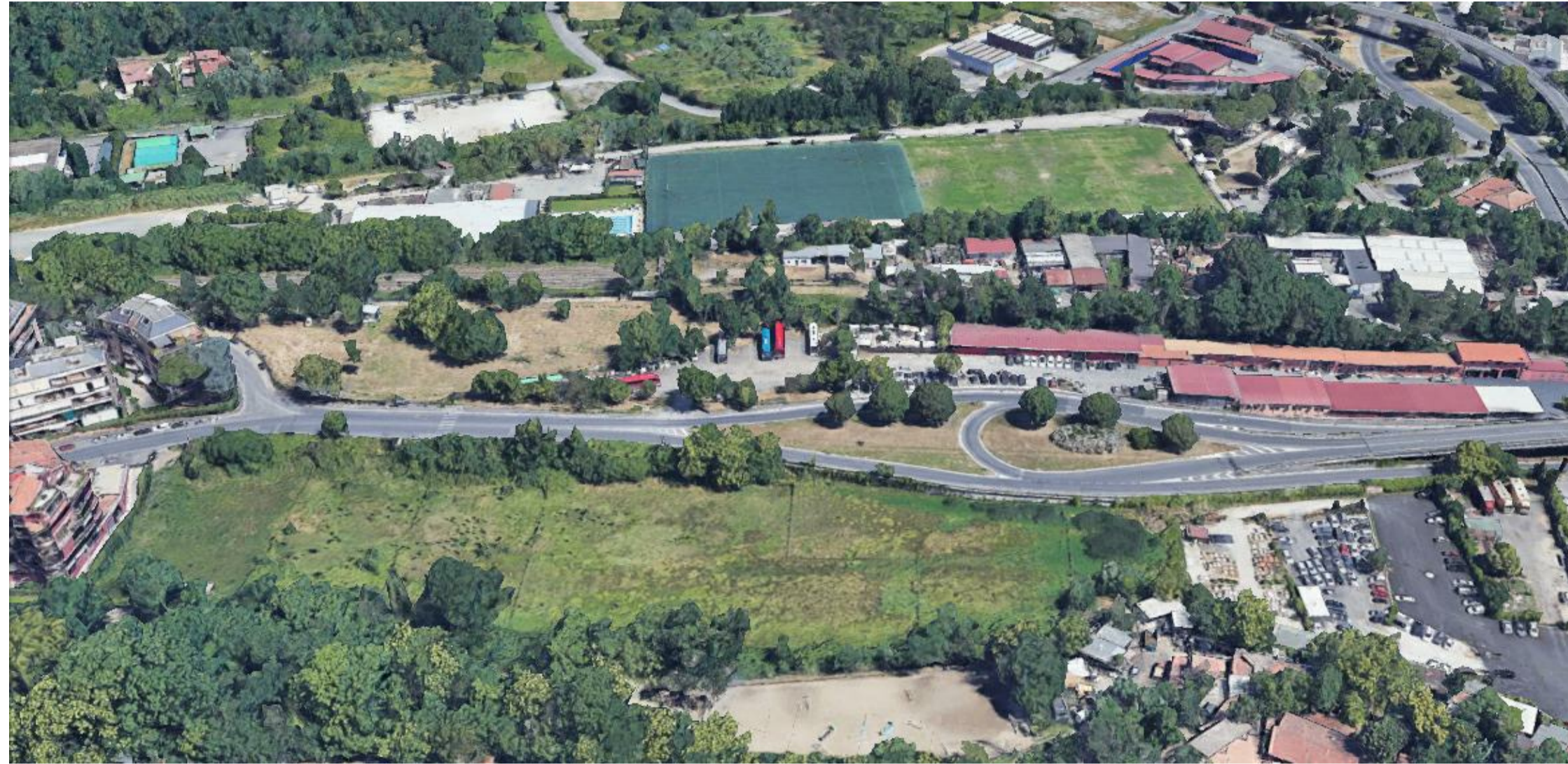
STATO DI FATTO VISTA AEREA