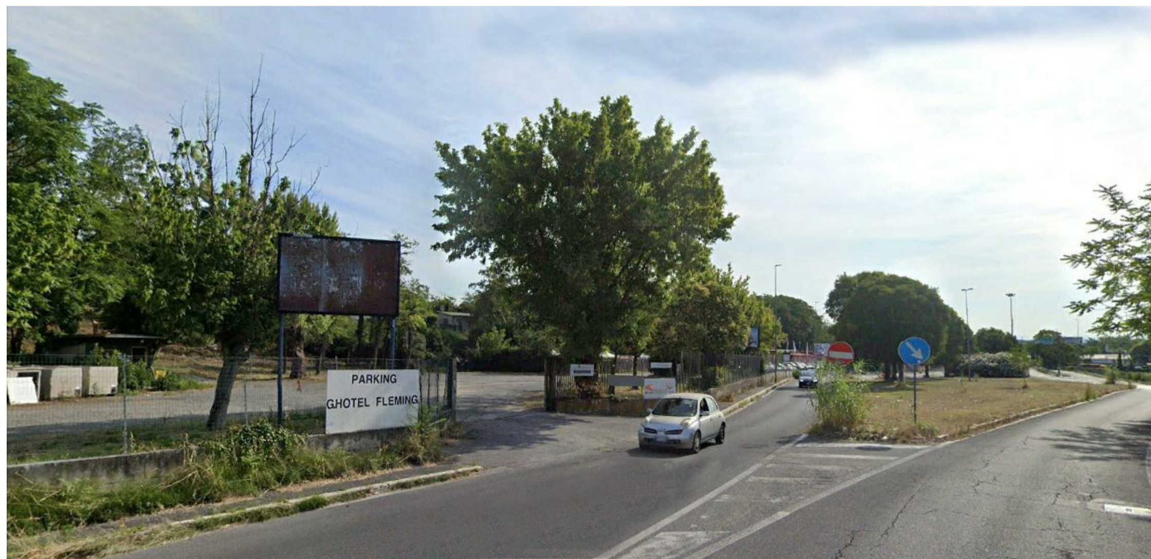
STATO DI FATTO VISTA STRADA